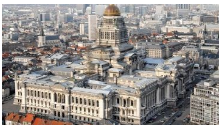
Palais de justice

Les bâtiments de ce pays sont pour la plupart en briques, quant au palais de justice il est majestueux. Les colonnes de pierres taillées sont gigantesques. Sa construction a commencé en 1866.